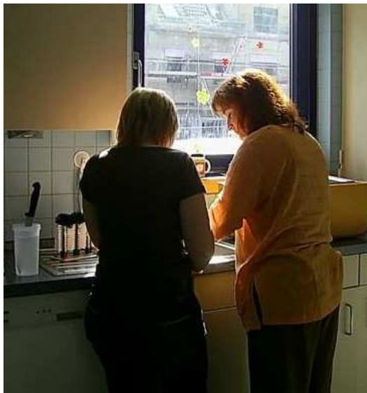
Eltern in Vorbereitung auf die Feier

Die Trommler-AG der Hauptschule Central zeigte zum Ende der Feier in eigenen Stücken wie auch in Kombinationen mit dem Circus Centralino ihr einstudiertes Können und erntete viel Applaus für ihre Darbietungen